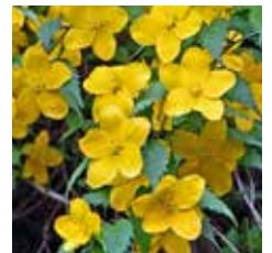
図 7 ヤマブキ

観察会ではサクラやウメがどうして薔薇と一緒に科になるのですか、と質問を受けます。確かに艶やかな栽培品種のバラ (図 5) とサクラ、ウメ