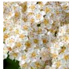
図 9 ナナカマド