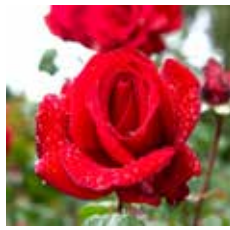
図 5 バラ栽培品種