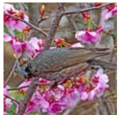
図3 ヒヨドリとサクラ