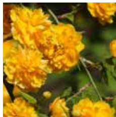
図 8 八重のヤマブキ