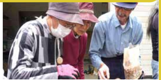
シイタケのコマ打ち体験 炭火でジュワツと焼きたてシイタケ 野草摘んで揚げたて天ぷら 初夏の味覚満載の宴を楽しみます