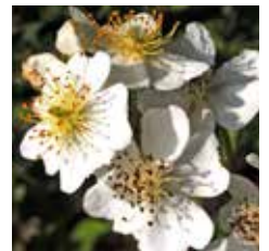
図 10 ノイバラの仲間