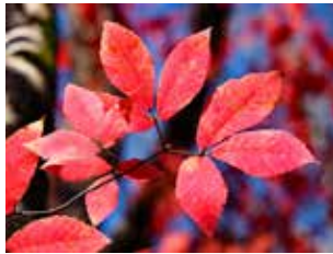
図10 メクスリノキ(日光植物園)