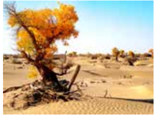
図1 胡楊（こよう）黄葉

江戸時代の錦絵などには紅葉した枝を肩に散策する絵も残されていますが、現代ではむやみに枝を折ることは御法度です。何故「紅葉」がモミジ（植物名）と読まれるのでしょうか？「もみじ」という言葉は「草木の葉が赤、あるいは黄色くなる」という意味の動詞「もみず」（紅葉す、文語体ではもみづ）に由来しているそうです。その連用形