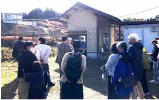
移住者の生活の様子を見学