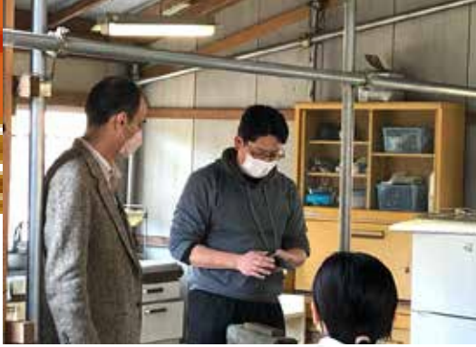
『包丁研ぎ』のデモンストレーションの様子