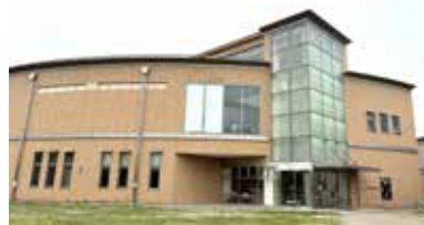
図7 現在の登呂博物館