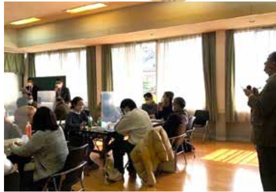
公民館にて移住者同士のディスカッションの様子。日頃の悩みなどを共有することで、お互いの理解が深まった

との交流を通じて、多様な情報や経験を相互に共有する機会が得られたという声が挙がりました。 持続的な人的ネットワークの形成 最後に、交流会を実施したことによって相互理解の深化および信頼関係の構築が促進され、持続的な人的ネットワークの形成につながったと実感しています。今後も谷地域のよりいっそうの移住促進に向けて地域コミュニティと活動を進めていきます。