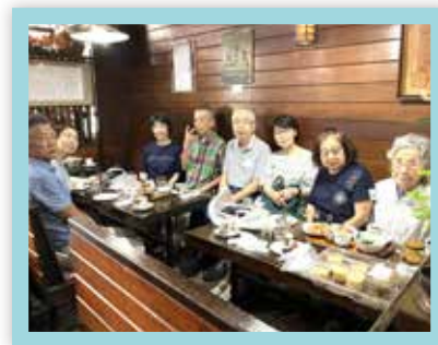
Iさん亡き後に開かれた談話室風景(9月6日)