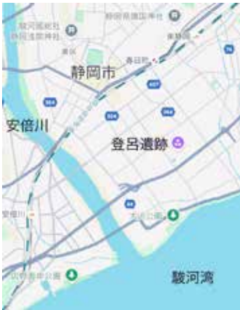
図1 登呂遺跡の位置

登呂遺跡のことはこの連載でも、第7回「住まいと建物の考古学」(たてあそび「竪穴建物編」と第10回「掘立柱建物編」)でお話しました。それは、全国の遺跡公園で復元されている竪穴建物や高床建物は、静岡県の登呂遺跡で復元された古代建物をお手本にしているものが多いということでした。