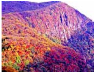
図13 いろは坂屏風岩の紅葉