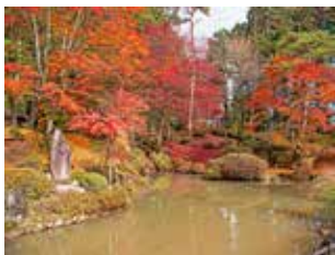
図5 日光輪王寺庭園

5〜6度で急速に進むことから「紅葉のスイッチは8度」などと言った方が、一斉に紅葉のスイッチが入るため、急に冷え込む年は紅葉がきれいになるのです。また、大きな樹木で形成される森林の状態では、紅葉する低木は日陰で生育しています。林内では日差しのある場所より最高温度が下がり、最低温度は高くなるので紅葉は一気に進まず、中途半端に終わってしまうのです。森林利用の盛んだった昭和の時代には、ブナ林(図3)などの自然林が盛んに伐採利用され、その跡地にスギやカラマツなどの針葉樹が植えられています。植えられた樹木の成長を妨げる雑草木は盛んに刈り払われ、このような若い造林地では大きな樹林の