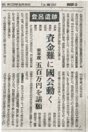
図6 国会決議を報じる新聞（登呂博物館）