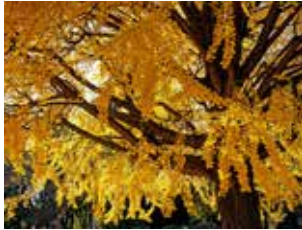
図2 イチョウ（上野公園）