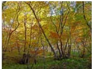
図4 イヌブナ林の黄葉