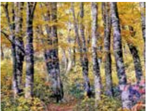
図3 ブナ黄葉（奥羽山脈和賀岳）

「もみじ」が、葉の色が変わることや、紅葉そのものを指す名詞へと変化しました。また、「もみず」は紅葉染めの「揉み出づ」に由来しています。ベニバナの花びらには紅色と黄色い色素の2種類の色素が含まれており、これを真水につけて揉むと、まず水溶性の黄色の色素を揉み出すことができます。次に、アルカリ性の灰汁に浸して揉むと、