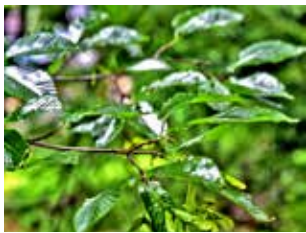
図11 チドリノキ(カエデの仲間)