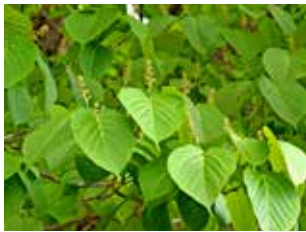
図8 ヒトツバ(マルバ)カエデ