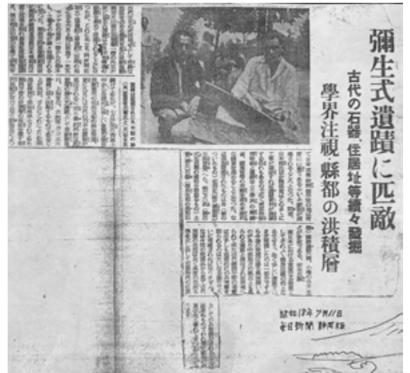
図5 丸木船の発見を報じる新聞 (毎日新聞静岡版、1923.7.11)

や琴など、代表的な木製品はこの第一次調査時に発見されたものであり、あとで述べるように戦後すぐにこの水田跡が破壊されてしまうことを考えると、困難な状況で敢行された第一次調査の重要性は計り知れません(図5)。