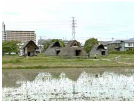
図2 住宅地に囲まれた登呂遺跡公園

原始古代の復元建物が最初に建てられた遺跡という意味でも登呂遺跡は重要ですが、さらに考古学会や歴史学会の近代化と