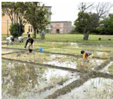
静岡市立登呂博物館 SHIZUOKA CITY TORO MUSEUM

た。それは敗戦という空洞を抱え、食糧難と物資不足で生きにくさを感じていた人々に、日本の文化的アイデンティティの根源を提示し、社会に一大考古学ブームを巻き起こしました。 登呂遺跡も発見からすでに80年余、新たに発見された佐賀県吉野ヶ里遺跡のブームなどにより、近年の小中学校の教科書に載ることも少なくなりました。しかし、今でも水田農耕をしていた弥生時代後期の人々の生活を生き生きと物語る最も重要な遺跡の1つであることには変わりはありません。