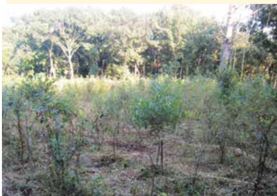
クロモジの植林地

現在は、アロマテラピーブームの中でクロモジ精油は各地で少量ながら採取されています。その原材料確保のために植林も行われるようになりました。クロモジは開放的で陽の光が当たるところよりも林木の下層などの半日陰を好むので植