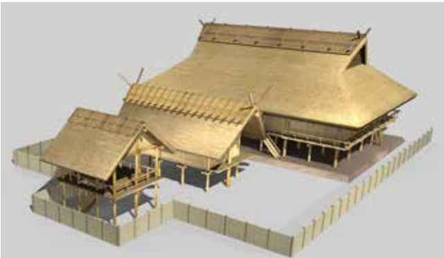
図8 纏向遺跡の大型建物群

でした。テレビで一部始終を見られた方も多いと思います。しかし石棺内部全体に朱が塗られていて、やはり身分の高い人物の墓だろうと目されています。