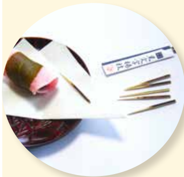
樹皮のついたクロモジの楊枝

前にも述べましたが、昔はクロモジの楊枝は黒楊枝と呼ばれていました。楊枝は中国でハコヤナギを材料にしていたので楊（やなぎ）の名がついたのですが、クロモジの皮を一部残して先の方を穂のように砕いて穂楊枝として歯ブラシのように使っていました。つま楊枝の代名詞のようなクロモジですがタケやシラカバなどの楊枝がある中で今でもクロモジから伝統的につくられているのが雨城（うじょう）楊枝です。