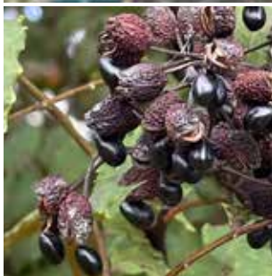
サンショウの実(上:赤く熟した実 下:熟して果皮がはじけた様子)