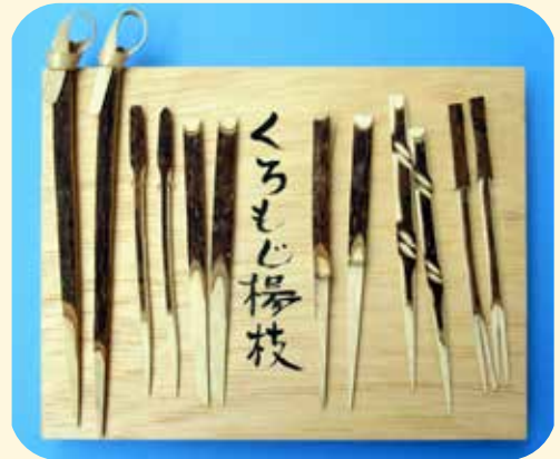
伝統工芸・雨城楊枝 (左から結び、うなぎ、会席、梅、竹、松)