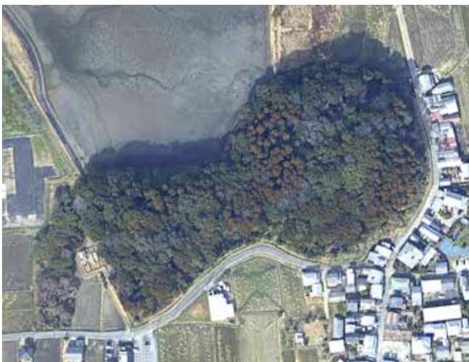
図10 箸墓古墳航空写真 Google Mapより

いずれにせよ、吉野ヶ里遺跡はまだまだ発掘調査が継続中、纏向遺跡はまだ全体の5パーセントしか発掘調査が終わっておらず、ましてや箸墓古墳の主要部は未発掘なので、今後の調査結果によっては、これまでの説が補強されたりひっくり返されたりするかもしれません。そんなことを楽しみにして、発掘調査を見守っていきましょう。