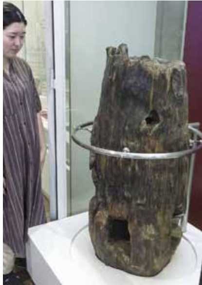
図9 池上曾根遺跡の紀元前52年と測定された柱根 (産経新聞 2024年7月10日)

ところで魏志倭人伝では卑弥呼の死後、径百余歩の家を築いたという記述があり、卑弥呼の墓はどこかとの議論が盛んでした。纏向遺跡の中にあ