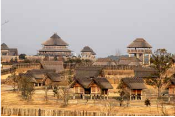
図5 吉野ヶ里遺跡の建物群