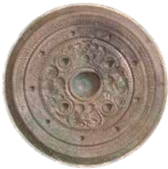
図7 三角縁神獣鏡の例