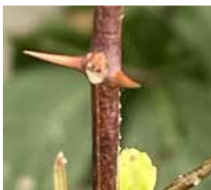
サンショウの枝にあるトゲ 左右に対に生えている

され、高さ2〜4mくらいに育ち、幹や枝に對になるトゲがあります。雄と雌の木は異なり、雌の木には晩秋にいぼいぼの赤く熟した実がつき、やがて割れた実の中からつやのある黒い種子が顔を出します。 春の若葉は、生そのまま吸い物に入れたり、やつこ豆腐にそえたり、田楽や木の芽あえ、塩焼きアユの香りづけやいろどりにされるなど、料理の引き立て役として利用される山菜です。また、秋の果実は粉末にして香辛料にされるほか、完熟まえの青い実を佃煮に利用します。安曇野の直売所ですりこぎが売られていることがあります。