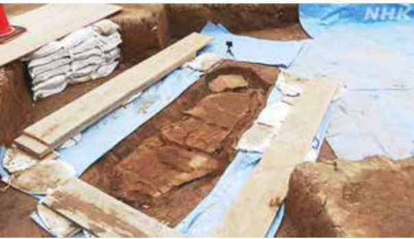
図6 吉野ヶ里遺跡石棺墓発掘時の様子