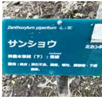
サンショウの樹木札 恩返し森薬用樹木園に植栽されている木々には、神農本草経による薬効などが書かれた樹木札が付けられています。

ひび、あかぎれに果皮の煎じ汁を外用します。歯痛、犬の咬み傷、毒虫刺されに葉のしぼり汁をつけ、木皮は回虫予防などに使われます。その他、授乳を終える時期に煎じ、砂糖を加えて飲むと乳の分泌が抑えられ、乳房の張りも収まるとされています。