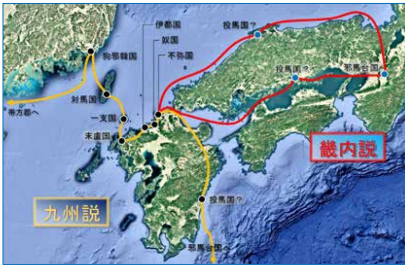
図4 邪馬台国九州説と畿内説を表した日本地図