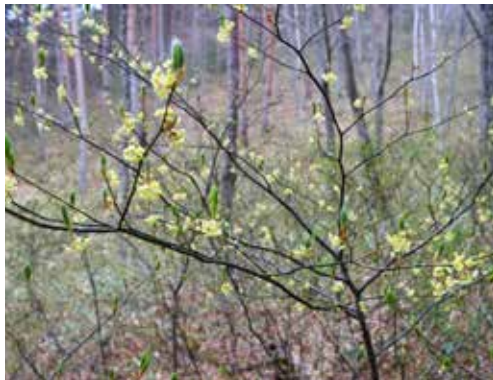
新葉の芽生えに先立ち咲くクロモジの花

（杓子）などです。それにならって黒楊枝が「クロモジ」になったというのです。 現在クロモジというつま楊枝の代名詞になっていますが、この説によると古い時代からクロモジが楊枝として使われていたことになり興味をそ