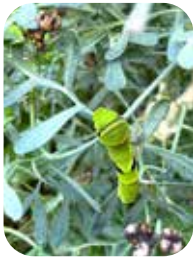
ヘンルーダの葉を食べるナミアゲハの幼虫

ちなみに、畑のニンジンや葉っぱには、ナミアゲハよりも羽色の黄色味が鮮やかな種のキアゲハの幼虫が育っています。