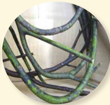
黒い斑点のあるクロモジの枝