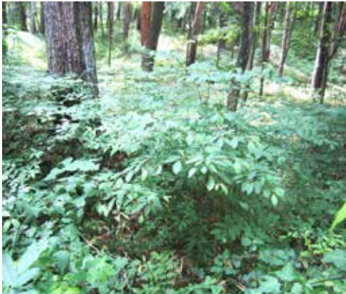
林内に生えるクロモジ

クロモジは株立ちで育ち、生育した幹を根元から伐採すると根際から新しい芽が出て新たな幹として育ちますので、資源としては好都合です。スギ林などに低木として育つクロモジはスギ材を利用する林業にとってはむしろ邪魔ものなのですが、クロモジ精油の利用が普及するにつれて脚光を浴びてきているのが現状です。