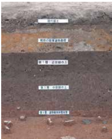
図 3 地層の例「難波宮跡発掘調査（NW 09-2 次）」大阪市教育委員会

ネットで「地層」を調べてみると「山から土砂が川によって運ばれ海に順番に堆積したもの」のように解説していることがほとんどですが、土砂が堆積するのはなにも海ばかりではありません。平地にも水や人間や動物の活動などによって少しずつ堆積しているのです。発掘調査はこの地層を一枚一枚剥がすように掘るといふより削っていく、遺構や遺物を発見していくのです。