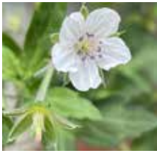
ゲンノショウコ 2024年8月安曇野

ふと家の北側にある小さな植え込みに目を向けると、ぼつぼつと1センチほどの白い花が咲いていました。どこから生えているかを見てみると、近くの里山から移植しようと採ってきたナツハゼの土と一緒にくっついてきたようで、右に左に伸びて元気がよい。さっそく調べてみると、ドクダミ、センブリとともに日本三大民間薬とされるゲンノショウコでした。