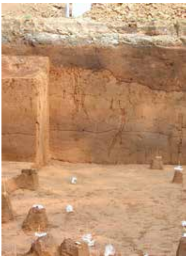
図5 関東ローム層の赤土「蜀江山遺跡1次調査」新宿区文化観光産業部文化観光課

発掘調査をしていると「小判でも出ますか」とよく通りすがりの人に聞かれるという話を以前しましたが、本当に小判が出たとき小判はその土地の所有者のものになるのでしょうか。答えはノーで、誰のものでもなく「落とし物」になります。発掘調査で出土した遺物は、「遺失物法」という法律に従い拾得物として管轄の警察に届け出ることになっています。警察は遺失物としての公告を掲示し、6ヶ月たっても所有者が判明しない場合は市町村や大学など調査機関が保管します。警察に届けるといっても、発掘調査で大量に出土する遺物を警察に持ち込んでも警察は置き場所に困るでしょうから、書類上のみ届けることになっています。