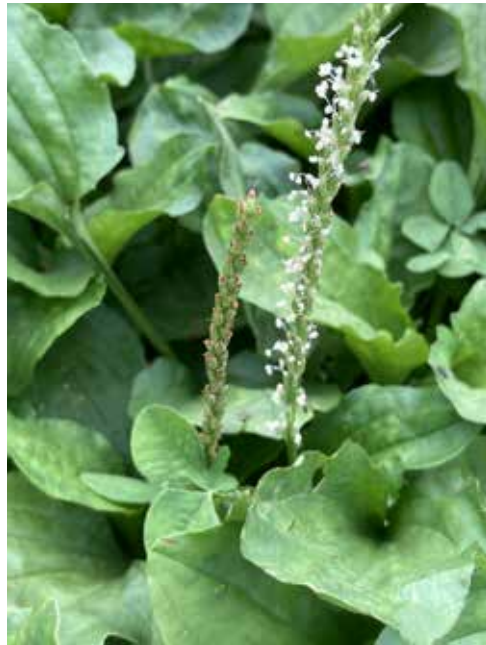
図1 オオバコの葉と種子

抵抗が特に強い多年草です。葉が大きいことから「大葉子（おおばこ）」と呼ばれます。食用ともなることから万葉集