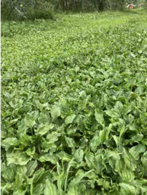
図2 軽トラによく踏みつけられる所に群生するオオバコ（我が家のリンゴ園）2024年8月

オオバコは、日本各地や東アジアに広く分布し、普通に見られる典型的な雑草で、踏みつけに対する