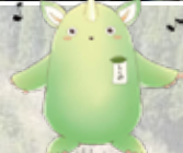
地球に恩返しの森 公式マスコット しんのちゃん