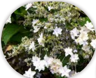
図5 園芸種「墨田の花火」