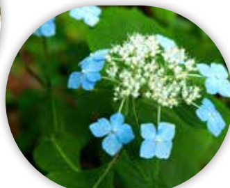
図6 ヤマアジサイの花形