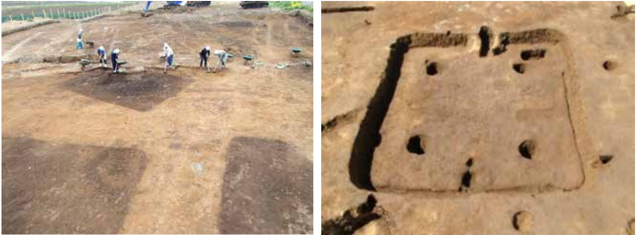
図4 左：黒く四角く見えるところが遺構です 右：掘ると古墳時代の竪穴住居でした 「榎野地北遺跡」埼玉県埋蔵文化財調査事業団 HP