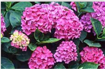
図3 力強いアジサイの葉（赤花）