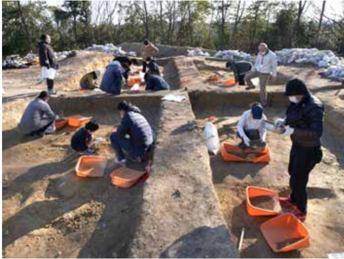
図1 富雄丸山古墳の発掘調査に市民が参加