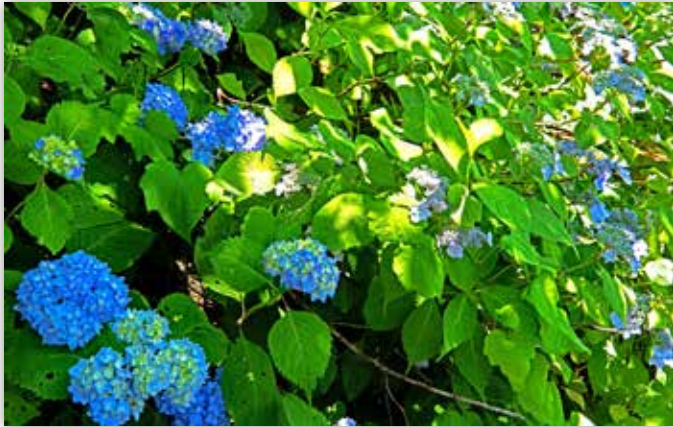
図4 手毬咲きのヒメアジサイとエゾアジサイ