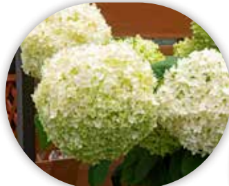
図7 アメリカアジサイ