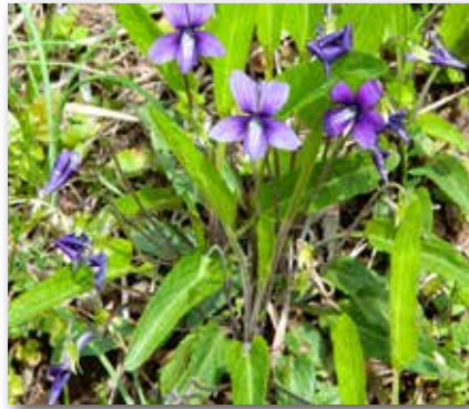
図1 種を表すスマイレ

トップバッターは4月のスマイレ。牧野先生はスマイレがお好きだった。マキノスマイレと和名に献名されていますし、高尾山の名を冠したタカオスマイレや学名には、命名者Makino になっているスマイレがあります。高尾山は地理的に暖温帯