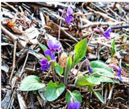
図4 アカネスミレ 大分・地球に恩返し の森 神農さんの森にて

野植物一家言より）。『三色スミレの花』 三色スミレは Viola tricolor Linnaeus の学名を有し、其一花の辨に、黄、紫、白の三色を具えて居るから、其れで、さう謂れるとの事であるが、併し、今其花を検して見ると、近來の花では、きちんとさう成つて居無い事が見られる。三イロスミレと謂つても良い訳では在れど、誰れも、さう謂つて居無いので在る。サンシキスミレは、明治年間に、伊藤圭介先生の子息讓氏が（早逝）『植物略解』と題する書物に図入りで其略解を書いたのが始めて在る。其時分には、未だ日本へは来ていなかった。そして其三色スミレは、今はサンシキスミレと呼ぶのだが、或いはサンシヨクスミレと謂うのが原との命名らしく、其れは今日の様に、サンシキスミレと呼ぶのでは無かつたらしく感ずる。洋名はPansyである。スミレの花には、皆な花の後方に、極まつて一の距を有しているのだけれども、此の三色スミレに限つて、それが無く、唯五本のおしべのみがある。欧州に在るが野生の品は、其花が小形で、亦其花色も黄紫白と揃つて居るのだけれど、今日の栽培品では、其れが実に無茶苦茶で在る。以下略』