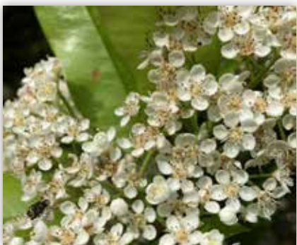
図 3 オオカナメモチの花（大分県・薬用樹木園）