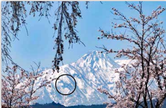
図1 妙高山の雪形「跳馬」 ほねうま

桜前線はマスコミの造語ですが、気象庁による開花予想の資料では桜開花予想の等期日線図と書いていました。桜前線のような植物などによって気象条件を予想することは、明治から大正にかけて、日本各地で冷害などによる農産物への被害