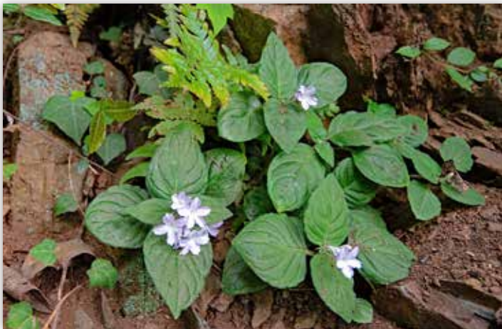
図7 競争相手のいない岩陰で元気のよいイナモリソウ