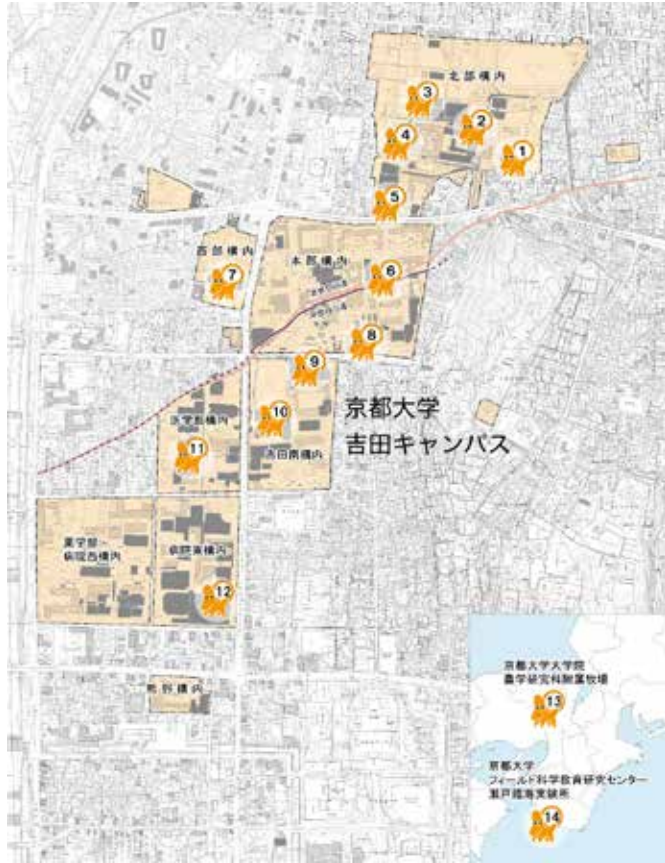
図1 「京都大学構内遺跡マップ」

● 京都大学 埋蔵文化財研究センター 発掘調査をしていたのは、京都大学埋蔵文化財研究センターというところで、現在は改組され名称が変わっています。どこを調査していたかというところと大学の構内です。大学の中だけですかと思われられるかもしれませんが、京都大学は左京区の吉田