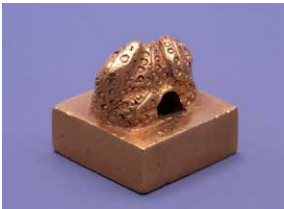
図 4 「金印」 福岡市博物館 HP より

「インディ・ジョーンズ」ディズニー公式 HP より 「すみません小判は出ません」と返事して謝る場を通りがかった人から「小判でも出ますか」とよく声をかけられました。「すみません小判は出ません」と返事して謝る