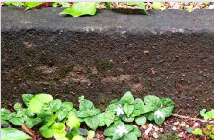
図8 人工的な場所に生きるイナモリソウ

ですが、山崩れが起きる前はヒノキの立派な林（少し残っている）で、1号路に素敵な木洩れ陽が提供されていました。その頃、急な斜面を切り開いた1号路の崖になった部分の岩陰で、立派なイナモリソウが咲いていたのです（図7）。自動車が通れるように広げられた場所でしたが、斜面を切り取っただけの岩の隙間は、ヒノキ林の木陰で、競争相手の草丈の高い植物は生育できずに、イナモリソウのお屋敷として好ましい環境でした。強い陽射しの石垣の隙間や舗装道路の切れ間で、遅く生きる帰化植物のように、思いがけない場所で、イナモリソウは命を繋いでいました（図8）