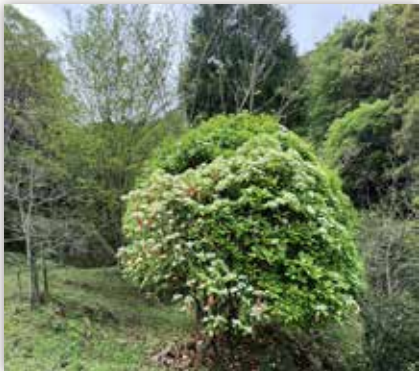
図 2 オオカナメモチの樹形（大分県・薬用樹木園）