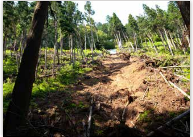
図5 高尾山の崩壊地