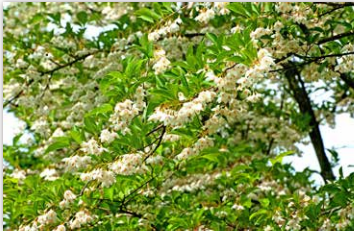
図4 エゴノキ 白く垂れ下がる花の様子