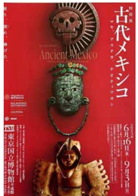
図2 「古代メキシコ展」

キャンパスだけでも東京ドーム16個分とかなり広く、他に宇治キャンパスや、新しくできた桂キャンパスもあります。その他にも全国各地に付属施設があります。