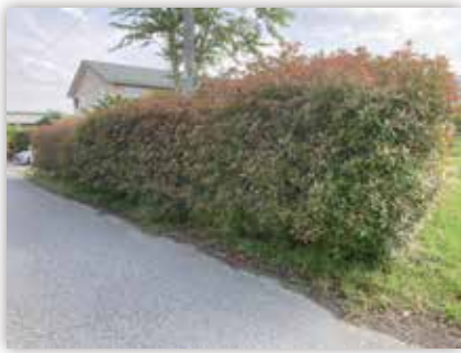
図 1 生垣に使われているカナメモチ（安曇野市）