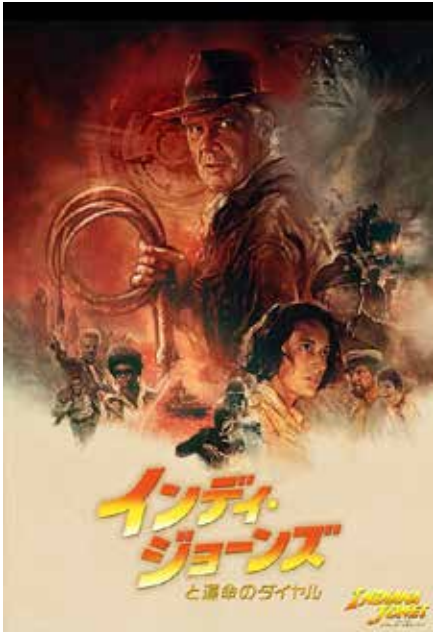
図 3 「インディ・ジョーンズ」 ディズニー公式 HP より

「インディ・ジョーンズ」ディズニー公式 HP より 「すみません小判は出ません」と返事して謝る場を通りがかった人から「小判でも出ますか」とよく声をかけられました。「すみません小判は出ません」と返事して謝る