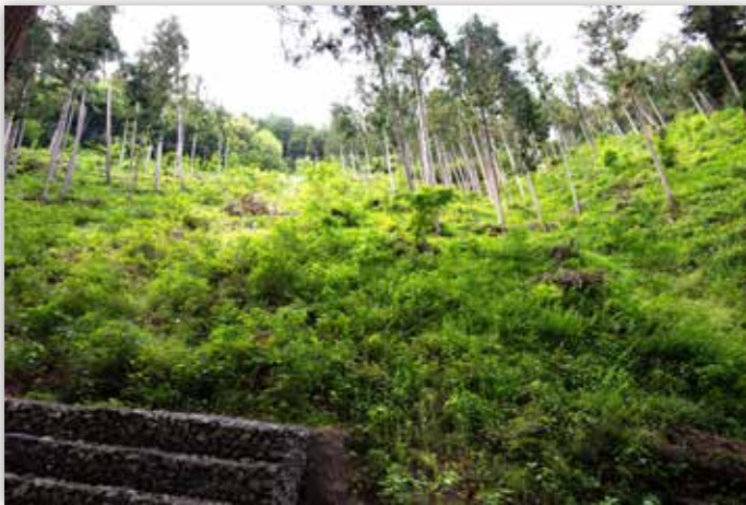
図6 強い日差しを好む植物が一斉に緑をつくる