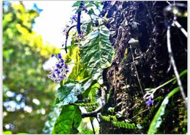
図3 イワタバコ 懸垂した花序 ※花序：枝上における花の配列状態

イワタバコは、牧野富太郎の『植物記』（桜井書店、1943）に「萬葉歌の山チサ新考」のなかで、これまでの植物名の解釈、エゴノキをイワ（ハ）タバコだとする記述から牧野植物に出会うでも取り上げられていました。