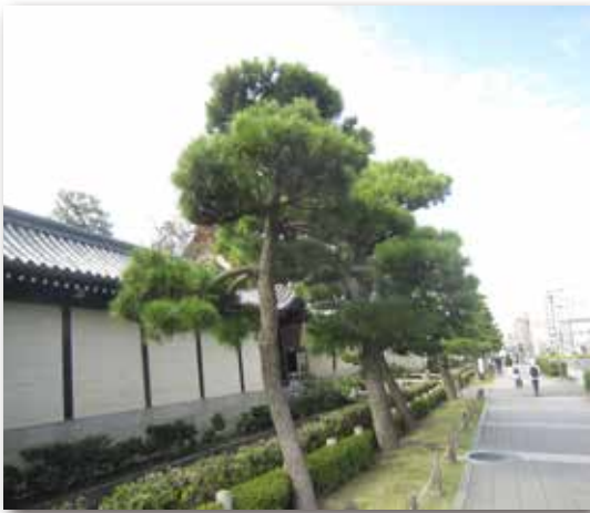
図1 街路樹としてのマツ

「年の始めの例（ためし）とて終（おわり）なき世のめでたさを 松竹（まつたけ）たてて 門（かど）ごとに祝（いお）う 今日こそ楽しけれ」と竹と共に歌われてきたマツですが、貝原益軒の「大和本草」に「まつはたもつの意、久しく寿を