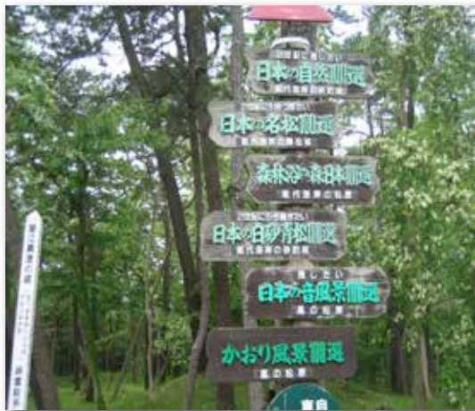
図2 風の松原（秋田県能代市）

され、景勝地となっている場所をよく見かけます。三保の松原（静岡県）、虹の松原（佐賀県）、気比の松原（福井県）は日本三大松原として知られていますし、環境省が選定した「かおり風景100