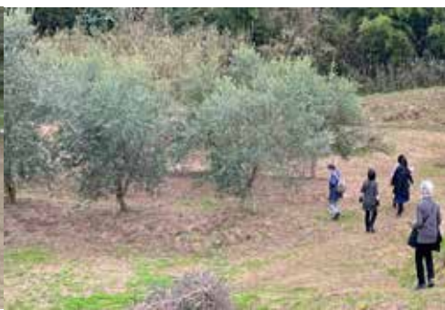
のぼたけ 野畑地区 オリーブ畑視察