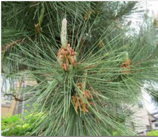
図4 クロマツ雄花（ここから無数の花粉が飛散する）

有の少しばかりヤニ臭くもあるマツの香りとともに花粉が飛び出します。花粉と共に飛び出すマツの香りには、血流を促進し、からだに活力を与え、リラククス効果があることが分かっています。が、しかし、マツ林のそばにでも車を停めておけば、ボンネットやルーフがすきまないほどにあざやかな黄色の花粉で埋め尽くされます。それほどに飛び交う花粉ですがスギの花粉症で悩む人が多いのにマツの花粉に悩む人はあまり聞いたことがありません。それどころか中国ではめまいや下痢の薬として花粉が利用されているというから驚きです。