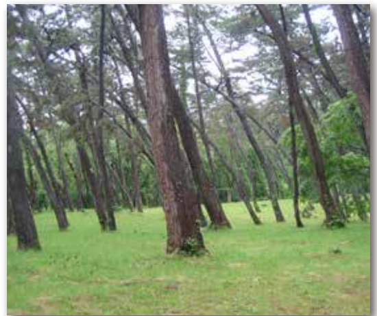
図3 海岸防風林（海からの強風にあおられて斜めに立つマツの木）

貧栄養の土地でもよく育つアカマツは養分の少ない尾根筋に分布し、山間部でも普通に生育していますし、クロマツは砂防林や防風林として植林