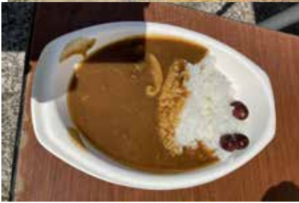
ジビエカレーと 2023年秋に収穫した オリーブの実の塩漬け

心尽くしのおもてなしに 皆、舌つづみ 式典の後には、地元の皆さんにもお手伝いいただき、テントの下で用意された郷土料理の「だご汁」、山の恵みをいただくジビエ料理として、イノシシ肉の煮込みカレー、クヌギ林の間伐