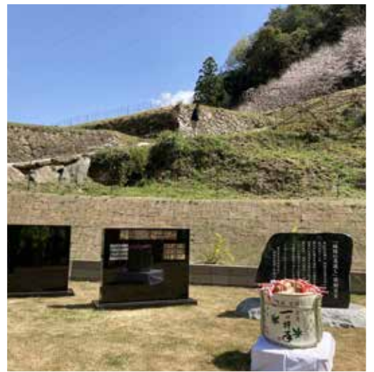
寄付者銘板のお披露目除幕式典のようす樽酒でお祝いました