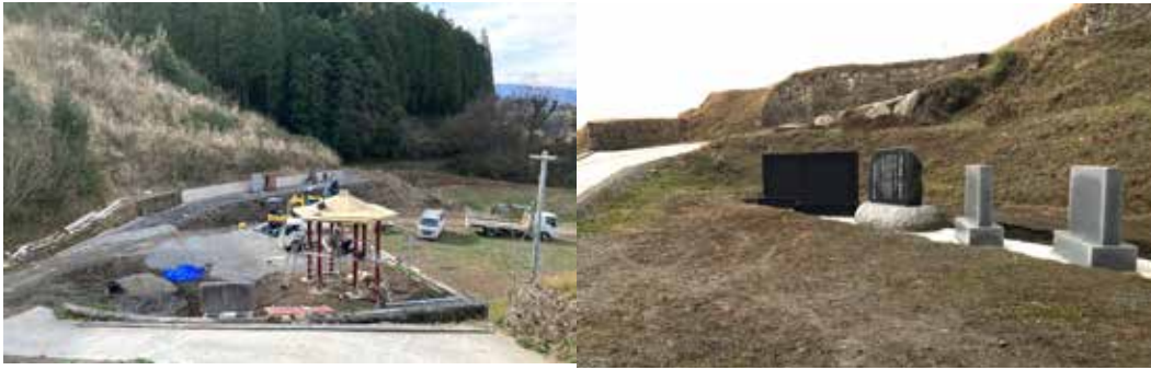
建設途中の鐘撞き堂（左）と銘板（右）

な繊維が集まったような構造をしていて、適度に重く柔らかく、よく通る綺麗な音が鳴る」といわれているので、地域に育つ棕櫚の幹を用いました。