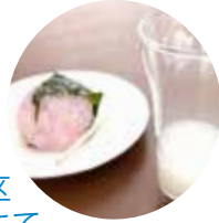
いけのくぼ 池久保地区 桜が咲く丘にて