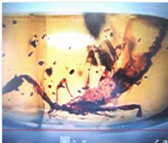
図5 虫を封じ込めた琥珀

にわたる地中の圧力で固化したものが琥珀です。琥珀の中には蚊やトンボなどの昆虫が閉じ込められているものがあります。昆虫がマツヤニに足を取られそのまま地中で固化したものです。SF映画の「ジュラシックパーク」では琥珀の中に閉じ込められていた恐竜の血を吸った蚊から恐竜のDNAを取り出し恐竜をよみがえらせるといったストーリーがあります。実際には科学的に無理のようですがSFとしては興味をそそられる話です。