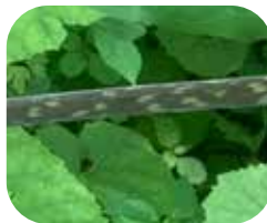
マムシグサの偽茎の模様