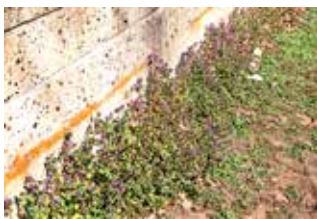
写真3 堀際、陽だまりの植物 ホトケノザ

面に張り付いたような切れ込みのある葉が見られます(写真5)。これはナガミノヒナゲシの冬越しの姿(根出葉、ロゼットと呼ばれる)で、3月から4月の春本番の頃、すなわち開花の時期には、草丈が肥沃な場所では1mくらいまで成長します。河川敷などを利用したポピー畑が一時はやっていましたが、そこから逸出して道端などあちらこちらに見られます。しかし、数年前の大群落は、見られなくなってその生育地は、移動分散しているようです。 春のひととき、春早く所を得て開花するもの、春は名のみと春の装いはまだまだの植物、同じ場所でも多様な植物、その姿が観察できますよ。