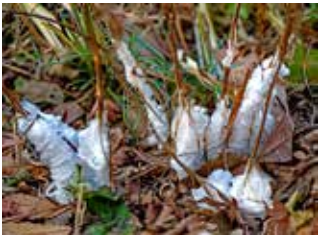
写真2 シモバシラ、冬の花

残っている水分が凍りつく姿(写真2)を霜柱に見立てた名前です。まだ茎が完全に枯れる前の初冬に、強い寒気が訪れると形も大きさもさまざまな「霜柱」が見られます。