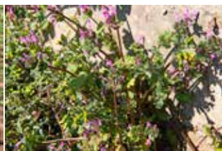
写真4 赤い花のホトケノザと 黄色のノボロギク