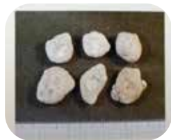
茎を乾燥させた生薬

どの少し日陰の湿ったところを好む多年草です。偽茎と呼ばれる葉の根もとが重なり合っているようになった部分がマムシの