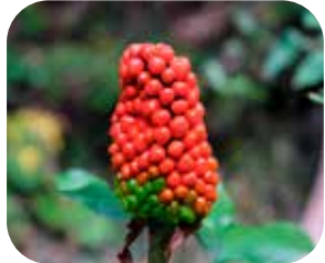
右：里山にみられるマムシグサ 左上：マムシグサの花 左下：マムシグサの実（マムシグサの実は有毒です）