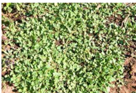
写真5 未だ冬姿の ナガミノヒナゲシ (ポピー)