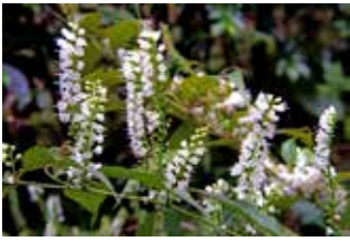
写真1 シモバシラの花、10月ごろ開花

シモバシラの花(写真1)は白く、細い柱のように見えるので、花姿から名づけられたように思いますが、冬に地上部が枯れたあとの茎に