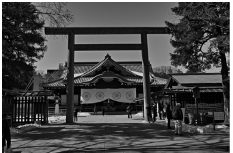
靖国神社鳥居と拝殿