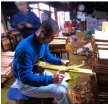
写真3 銚で樽丸をつくる

スギ葉の香り全体にリラックス効果がありますので、その働きが大きいと思われれますが。成分の一つとして含まれているα-ピネンという香り成分に、寝つきを良くする働きがあることが分かっています。そして中途覚醒時間が短いので全体的に睡眠効率が高い結果となります。寝つきを良くすることで知られているラベンダーよりもα-ピネンは効率が良いのです。