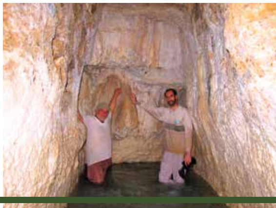
世界農業遺産『イランにみられるカナート』 乾燥地帯で行われている地下水路システムのことです。山麓の水脈から横穴を掘って地下にトンネルを作り、乾燥地帯であっても水を蒸発させることなく、遠くの町や田畑まで水を運ぶことができるシステムです。

よう保全し、世界遺産を訪れる多くの人は過去の人々の暮らしや知恵などについて学習しに行くとします。 一方、GIAHSは文化遺産や自然遺産に限定せず、地域コミュニティが形成してきた景観や自然資源、そして人々そのものが一体となり私たちの生活で重要な生物多様性、生産性や機能性を高める「農業遺産システム」に焦点を当てています。