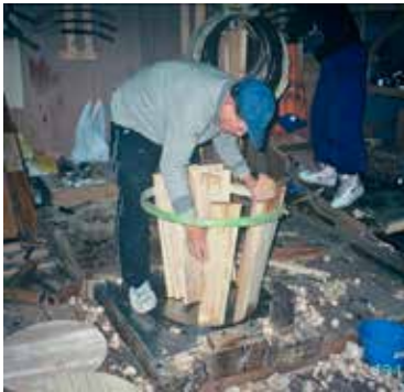
写真2 樽丸を組み立てる