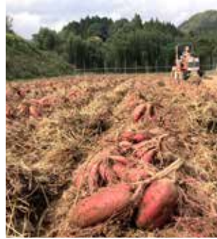
②トラクターで芋を掘り起こしてゆく