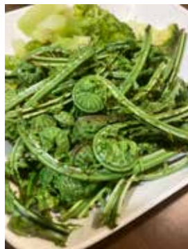
春の訪れを感じる 我が家の食卓を彩るコゴミ