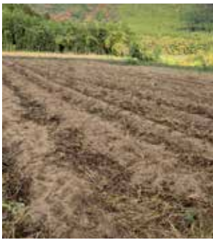
収穫後のサツマイモ畑