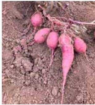
連なってるサツマイモ