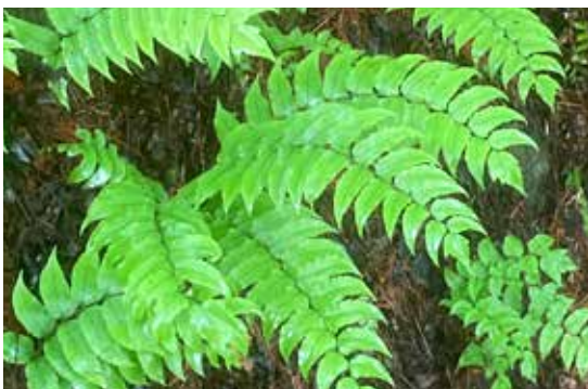
山地の湿った岩の面に生育 長野県安曇野市 2022.5.14