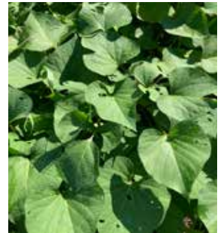
夏の間育ったサツマイモ。 ①ツルを切り、マルチをはがし収穫の準備をする