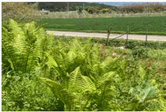
里山の草地に群生するクサソテツ（コゴミ） 長野県安曇野市 2022.5.7

神農本草経に収載されている生薬の中から植物由来のものを不定期にご紹介させていただきます。普段から何気なく生えている身近な野草が実は生薬であることが少なくありません。前回に引き続き私の住む長野県安曇野市の里山から紹介します。